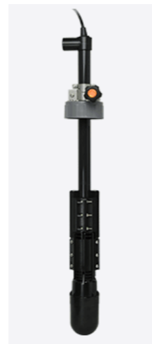
ソナーセンサー (取付例)

本クラゲ検知装置の振動子には小型マルチスキャン ソナーセンサーを採用しており、周囲 360° の監視を行うことが可能です。またチルト角も 0~90° の範囲に任意に設定することができ、設置場所に合わせた柔軟な運用が可能です。